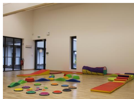
Salle de Chitenay