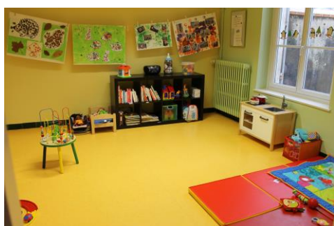
Salle du Ram de Cour-Cheverny